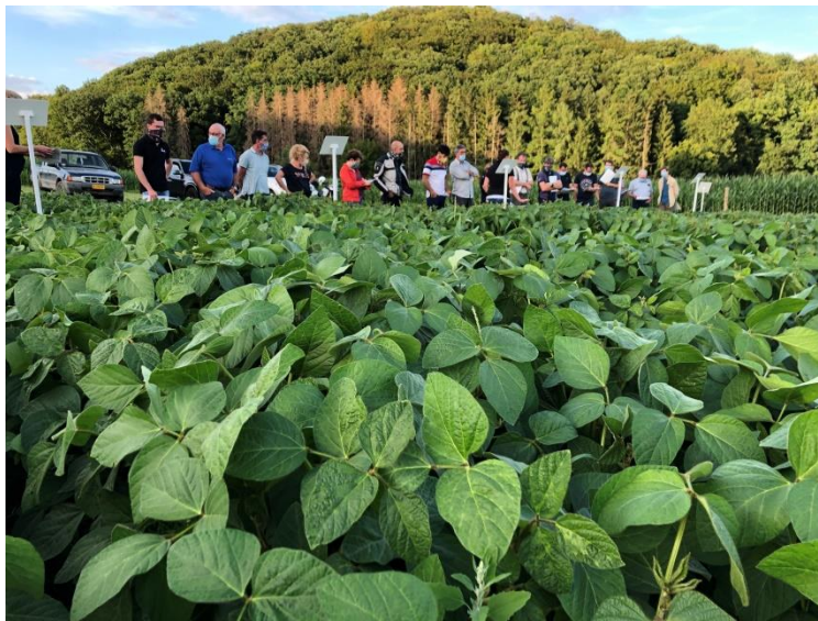
Abbildung 1: Feldbegehung am 09.07.2020 am Standort Bous unter Einhaltung der Hygiene-Maßnahmen

Die Abendfeldbegehung der Soja-Sortenprüfung im biologischen Anbau fand am 09. Juli 2020 auf dem Bio-Betrieb Johans in Bous statt. Die Feldbegehung war gut besucht, auf Grund der Schutzmaßnahmen im Rahmen der Eindämmung des COVID 19 Virus durften aber nur 20 Personen teilnehmen. Die Resultate der Soja-Sortenprüfung werden im Rahmen der Sortenkommission Anfang Dezember vorgestellt und im Newsletter des IBLA veröffentlicht. Des Weiteren können die Landwirte die Ergebnisse auf der IBLA-Webseite ( www.ibla.lu ) abrufen und sie werden über den IBLA-Verteiler versandt.