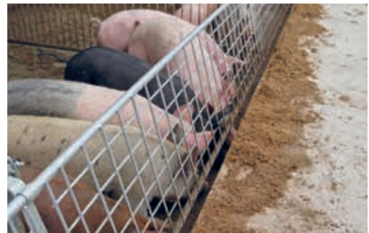
Die Überlegenheit der Eber gegenüber Kastraten bezüglich Tageszunahmen zeigt sich vor allem gegen Ende der Mast.

Die Ebermast gilt fütterungstechnisch als um einiges anspruchsvoller als die Mast von Kastraten. Zum einen muss man große Mengen essentieller Aminosäuren verfüttern, um die erwünschten hohen Magerfleischanteile zu erreichen. Zum anderen sollten die Eber vor der Geschlechtsreife zur Schlachtung kommen, also bevor der Ebergeruch einsetzen kann. Dies erfordert neben spätreifen Genotypen hohe Tageszunahmen.