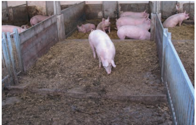
Eine gute Strukturierung der Bucht mit verschiedenen Funktionsbereichen bietet schwächeren Tieren Ausweichmöglichkeiten.