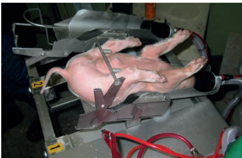
Die Kastration unter Narkose oder Betäubung ist zeitaufwändig und besonders für kleinere Betriebe kostenintensiv. Es ist ein Fortschritt im Vergleich zur betäubungslosen Kastration, bleibt aber ein Eingriff, der mit Stress und Schmerzen für das Tier verbunden ist.

Die Kastration ist ein gravierender Eingriff am gesunden Tier und für die Ferkel sehr schmerzhaft, wie Untersuchungen belegen. Während konventionell gehaltene Ferkel in den meisten Ländern Europas noch ohne Betäubung kastriert werden, sind Narkose oder Betäubung zur Schmerzausschaltung während des Eingriffs und/oder die Verabreichung eines Schmerzmittels für Biobetriebe vorgeschrie-