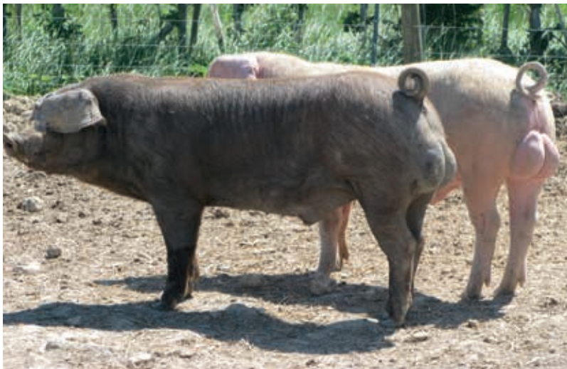
In den nächsten Jahrzehnten ist mit einer wachsenden Anzahl geruchsarmer Eberlinien zu rechnen.

Lange wurde befürchtet, dass sich die Zucht gegen den Geschlechtsduft Androstenon negativ auf die Fruchtbarkeit auswirken könnte. Neue Untersuchungen haben jedoch gezeigt, dass keine eindeutigen Beziehungen zu den Fruchtbarkeitsmerkmalen bestehen.