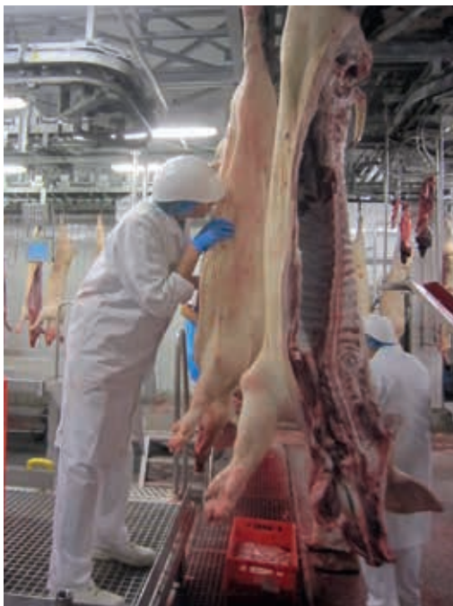
Die Geruchsprobe erfordert eine sensible Nase und einige Erfahrung. Idealerweise wird die Probe von zwei oder drei geschulten Prüfern durchgeführt.

Offizielle Grenzwerte, die besagen, ab wann das Fleisch von den Verbrauchern abgelehnt wird, existieren nicht. Trotzdem werden für Messungen 500 oder 1.000 ng/g Androstenon und 250 ng/g Skatol pro Gramm Fett häufig als Grenzwerte verwendet. Die Interaktionen zwischen diesen beiden Substanzen und weiteren Komponenten machen die Beurteilung des Ebergeruchs jedoch schwierig.