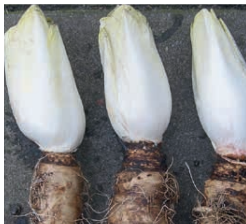
Die Chicorée-Wurzel könnte sich für die biologische Eberfütterung besonders gut eignen, da sie in Bioqualität verfügbar ist und von den Tieren gerne gefressen wird.

Auch eine rohfaserreiche Fütterung senkt den Skatolgehalt. In der Schweiz sind die Einsatzmöglichkeiten aufgrund der Fettzahlbezahlungskriterien jedoch eingeschränkt.