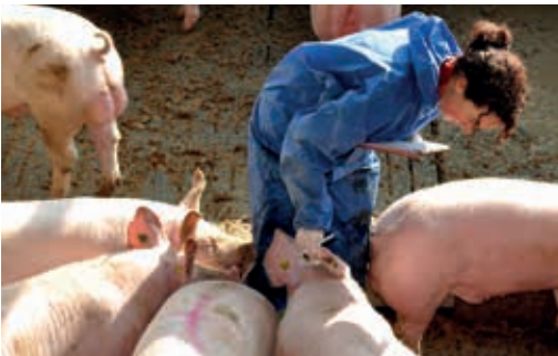
Eber sind ihren Artgenossen gegenüber häufig aggressiver als Kastraten. Im Kontakt mit Menschen können sie hingegen sogar zutraulicher sein.

Die Pubertät beginnt bei den Ebern im Durchschnitt mit 14–16 Wochen. Ab einem Alter von 17–26 Wochen sind sie zeugungsfähig. Die Produktion von Androstenon variiert aber auch saisonal. So wird im Herbst und Winter mehr und im Frühjahr und Sommer weniger Androstenon gebildet.