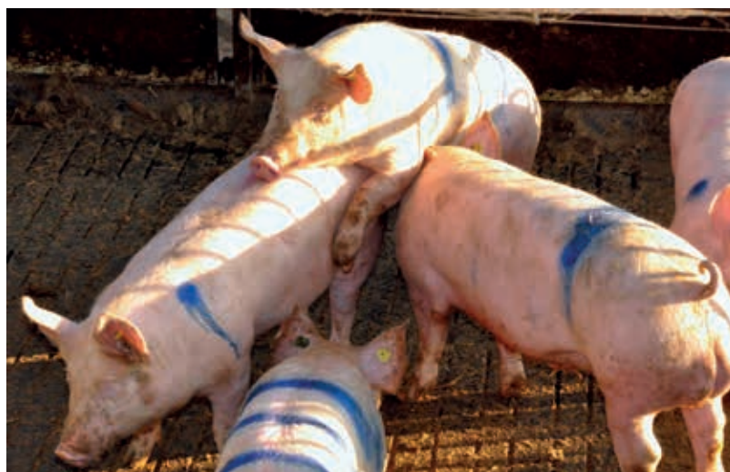
Um Trächtigkeiten auszuschließen, sollten bei gemischter Aufstallung von Ebern und Weibchen spätreife Genotypen eingesetzt und die Tiere vor dem Alter von 7 Monaten geschlachtet werden.

Bezüglich Androstenon, Aggressivität und Verletzungen schneiden die Geschwistergruppen eindeutig am besten ab. Dies hängt auch damit zusammen, dass für die Mast in Geschwistergruppen keine Umgruppierungen nötig sind.