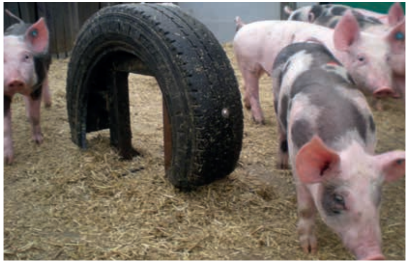
Eine Besteigungsattrappe kann dazu beitragen, dass sich die Eber nicht gegenseitig bespringen. Schwächere Tiere können sich zudem dahinter verstecken. Eine solche Attrappe lässt sich leicht aus einem Autoreifen bauen. Damit sie genutzt wird, sollte sie der Größe der Schweine entsprechen.