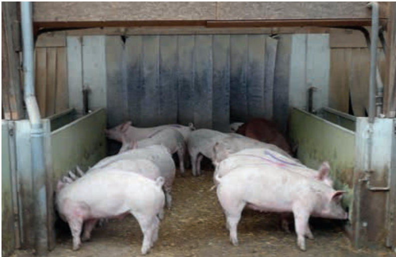
In Deutschland mästen zurzeit erst etwa 5 % der Landwirte Jungeber. Seit der Abnahmegarantie großer Schlachthäuser ist die Tendenz jedoch steigend.

Auf der iberischen Halbinsel werden traditionell nur wenige männliche Ferkel kastriert. In Großbritannien und Irland mästen die Landwirte bereits