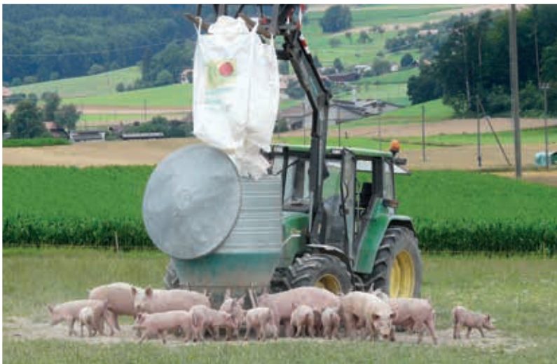
Während der ganzen Mastdauer sollte das Futter den Ebern ad libitum zur Verfügung stehen, damit sie ihr Mastpotenzial ausschöpfen können und nicht Futterneid zu zusätzlichen Aggressionen und Unruhe führen kann.

Die in der Praxis erreichten Zunahmen von Mastebnern sind mit denen weiblicher Schweine vergleichbar, liegen aber über denen kastrierter männlicher Tiere. Die höchsten Tageszunahmen verzeichnen Masteber bei einem Körpergewicht von 60–90 kg.