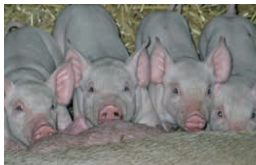
In Geschwistergruppen, also Würfen, die von der Geburt bis zur Schlachtung zusammenbleiben, zeigen Eber weniger Aggressionen.

In gemischten Gruppen besteht grundsätzlich das Risiko von Trächtigkeiten. Die Schlachtung trächtiger Schweine ist ethisch nicht vertretbar. Da weibliche Schweine erst mit 5–6 Monaten geschlechtsreif werden, ist nur bei extensiverer Mast und damit älteren Tieren mit Trächtigkeiten zu rechnen. Um Trächtigkeiten auszuschließen, sollte