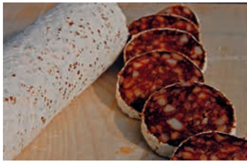
Aus geruchsbelastetem Fleisch können hervorragende Rohwürste hergestellt werden.

› Für die Verarbeitung kann bis 25 % geruchsbelastetes Fleisch in der Mischung mit geruchsfreiem Fleisch gemischt werden, ohne dass es wahrgenommen wird.